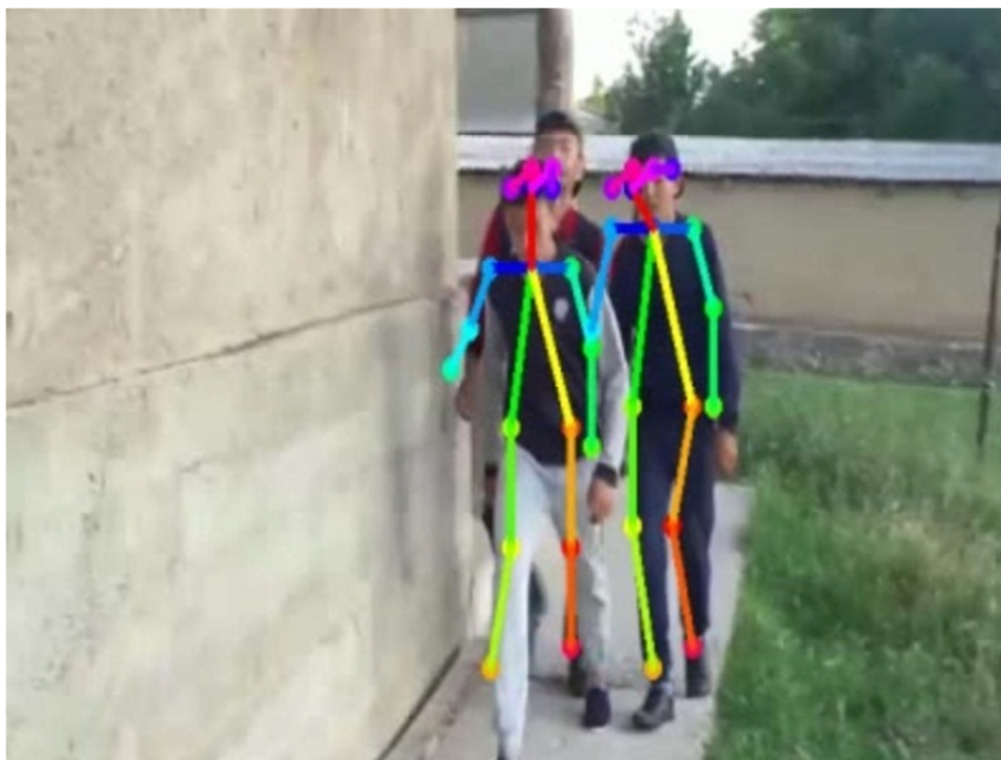
Рис.1. Построение графа точек человека (этап 1)

В итоге удалось получить видео со скоростью 12–14 кадров в секунду.