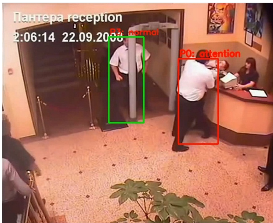
Рис. 2. Отображение различных типов действий (этап 2)

Также было замечено, что на данный момент распознавание действий не всегда корректно. Сильно оказывают влияние на конечный результат пропорции человека, изображенного на видео, и расстояние, на котором расположена камера. При чрезмерно близком расположении камеры увеличивается количество ложных распознаваний допустимых действий, в то время как при слишком далеком расположении камеры система не способна распознать человека на изображении).